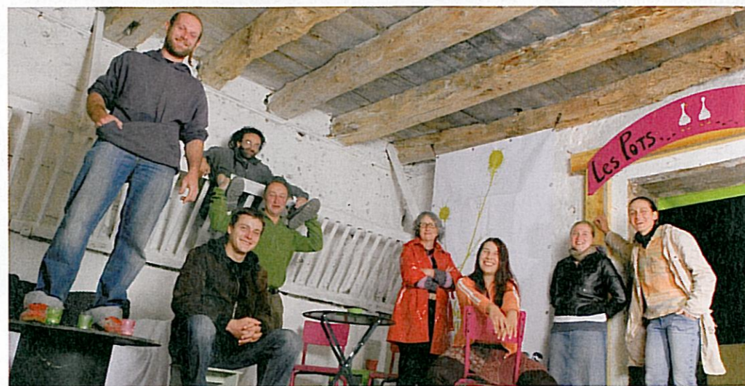
Cinq compagnies sous un même toit ? C'est possible aux Pratos. La ferme n'est pas encore entièrement aménagée, mais les activités vont bon train, depuis 2007. THOMAS CRABOT

mer le territoire. Pour y parvenir, ils écument les salles des fêtes des 24 communes environnantes et y organisent